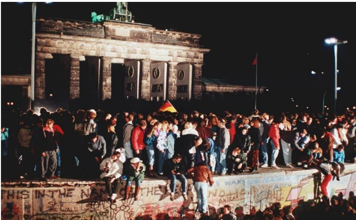
Muro de Berlín el 9 de Noviembre de 1989